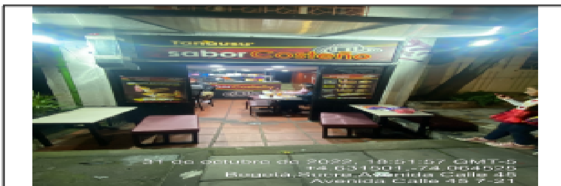
En la cual se evidencia la fachada del establecimiento comercial TANAUSU SABOR COSTEÑO , en la CL 45 No. 7 - 14 de la localidad de Chapinero.